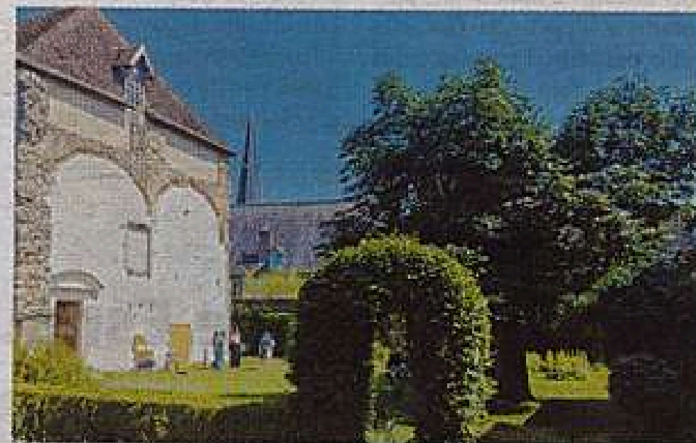
Début de saison à l'Abbaye de Tuffé Val de la Chéronne, le 2 avril

« Déclinée en quinze panneaux richement illustrés, l'exposition présente différents aspects des bourgs, de leur implantation initiale aux matériaux utilisés dans l'architecture, en passant par les principaux types de