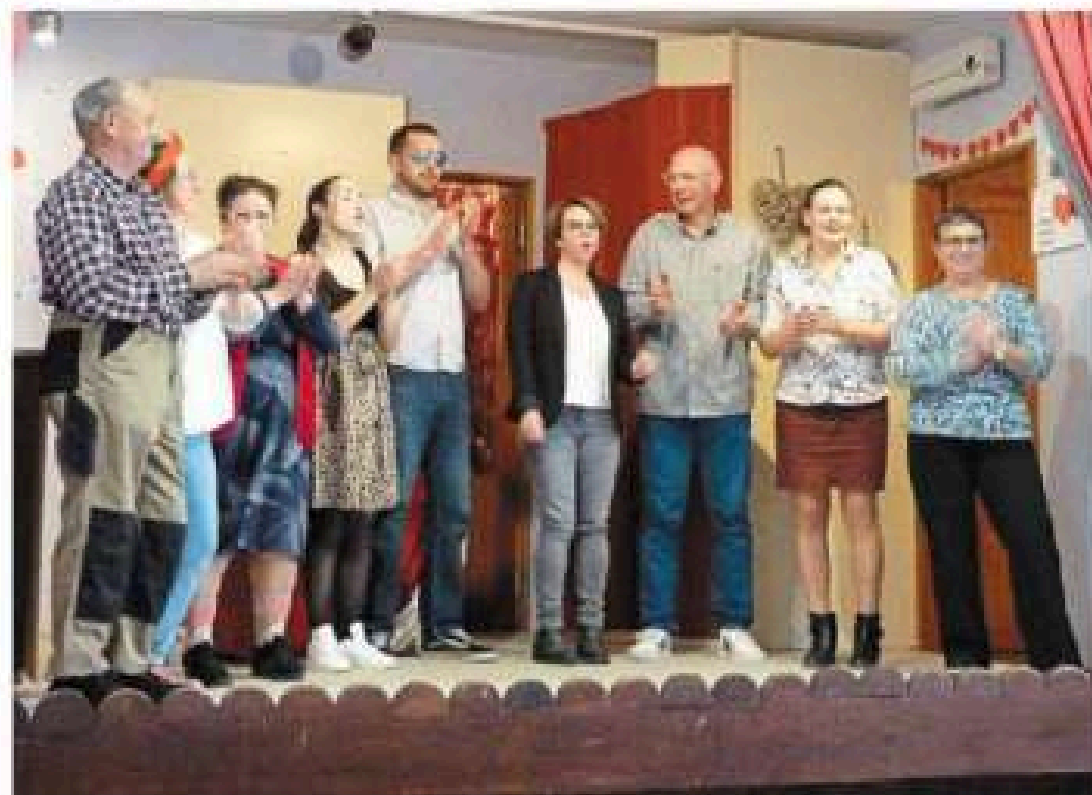
Les comédiens amateurs sont fin prêts à accueillir le public.

Ce samedi et samedi 21 mars à 20 h 30. Ce dimanche et dimanche 22 mars à 14 h 30. Vendredi 20 mars à 20 h 30.