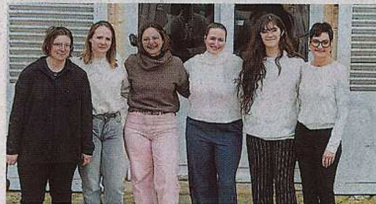
L'ensemble de l'équipe s'apprête à accueillir le public.

Côté été, les apéros au château se tiendront cette année les mercredis, du 8 juillet au 26 août, afin de cohabiter avec une activité « mariages » en plein essor. « Sur les week-ends disponibles, il n'en reste que deux », précise Kathleen, invitant à réserver au moins dix-huit mois à l'avance. Juin sera entièrement consacré aux scolaires et aux groupes avec des parcours sur mesure en lien avec les cycles, alternant visites et ateliers