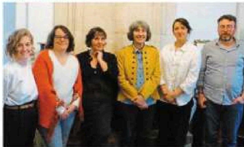
Une partie du collectif de la Roseraie.