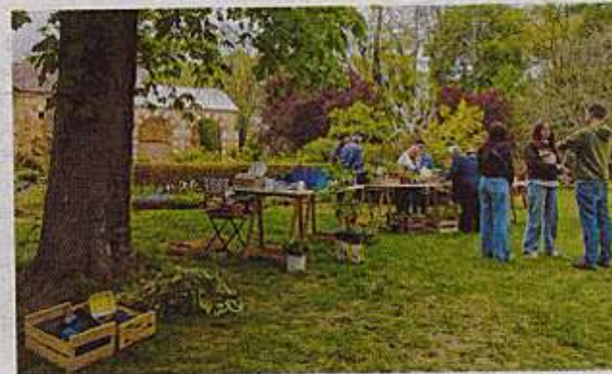
L'abbaye de Tuffé accueille toute l'année de nombreuses manifestations, comme ici le troc plantes.

L'abbaye, ce sont aussi des bâtiments chargés d'histoire également bichonnés. « Il y a eu un énorme travail dans le cloître pour restituer au bâtiment son ancienne visibilité. Et les travaux de menuiserie se sont poursuivis toute l'année. »