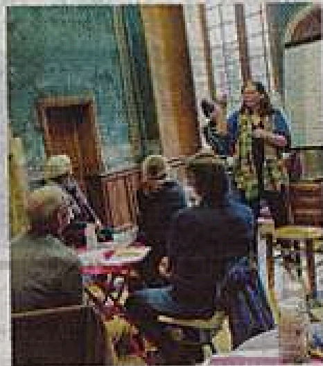
La poésie se libère auprès d'un bon feu à l'abbaye de Tuffé.

Qui promettent alors deux heures d'échanges et de complicité poétique au coin de la cheminée. « Évocation d'Howard Buten dit Buffo, le tendre clown -poète- écrivain- musicien- psychologue spécialiste de l'autisme... et bien plus, disparu en janvier 2025 », avancent-ils. Tout en