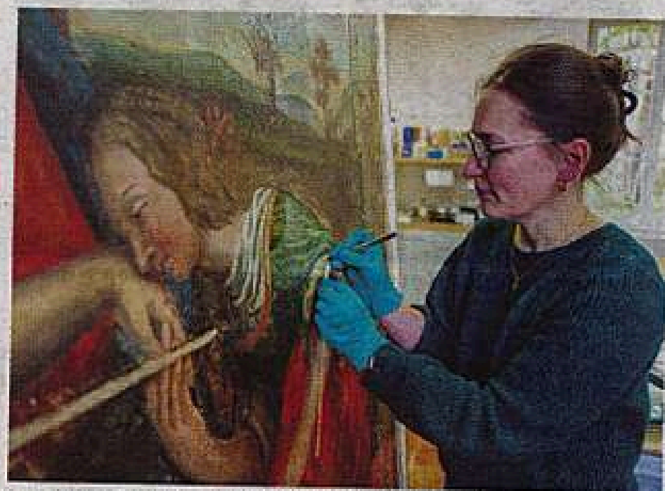
La Région Pays de la Loire et la Fondation La Sauvegarde de l'art français portent un projet pédagogique permettant aux lycéens du territoire de sauver des trésors du patrimoine ; cette année, des œuvres de Montreuil-le-Henri et Tuffé Val de la Chéronne étaient concernées.

Et pour la campagne 2026, les premiers lauréats sont justement connus, qui bénéficieront de l'aide des lycéens :