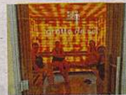
L'espace bien-être propose des horaires d'ouverture larges.

samedi et dimanche, 9h-12h et 14h-18h. Espace bien-être : lundi, mardi, jeudi et vendredi de 12h-20h ; mercredi, 8h30-20h ; samedi et dimanche, 9h-12h.