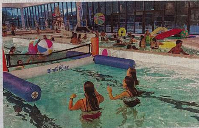
Pour clôturer la semaine anniversaire du centre aquatique Venizi'O, une soirée pool party est programmée, le samedi 4 avril.

Une équipe de vingt collaborateurs, que la directrice encense, parce que selon elle, ce sont eux