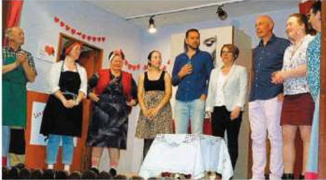
La troupe, à la fin de la pièce, est chaleureusement saluée.