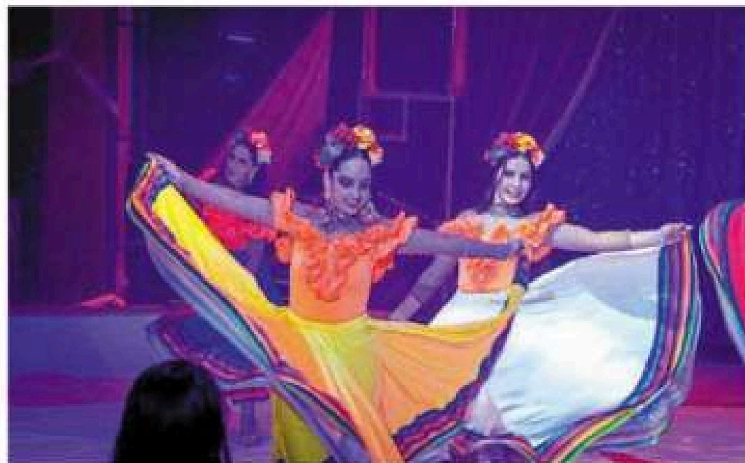
« La Grande escale autour du monde » sera présentée sous le chapiteau du cirque Zavatta Douchet jusqu'au 15 mars.

Envie de voyages et d'horizons lointains, le cirque Zavatta Douchet propose sa création grandiose intitulée « la Grande escale autour du monde », un voyage unique pour son retour dans la commune après un an d'absence.